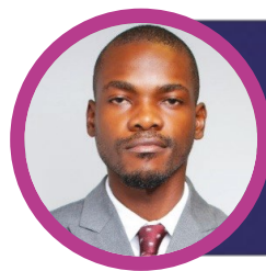
Dr. Ladislau Sousa Direção Nacional de Património do Estado Ministério das Finanças